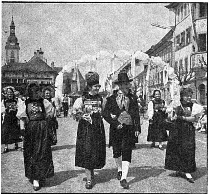
Un gracieux groupe de Guin et de Schmitten avec cerceau fleuri.

Dimanche 26 mai a eu lieu, à Bulle, la fête des patoisants fribourgeois. Elle coïncidait avec celle des costumes et coutumes.